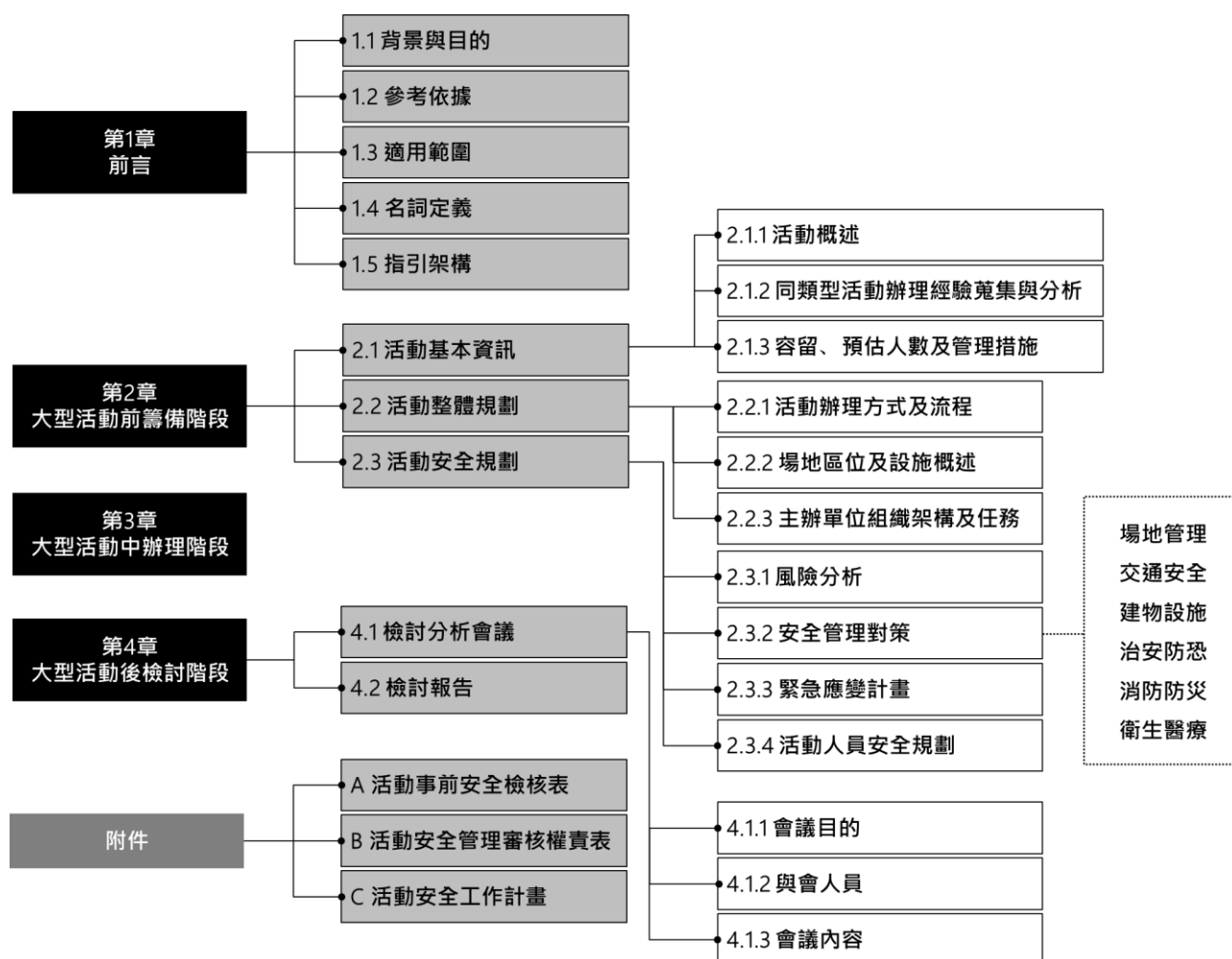
圖 2 大型群聚活動安全管理指引架構

本指引共分為4個章節，第1章為前言、第2章為大型活動前籌備階段、第3章為大型活動中辦理階段、第4章為大型活動後檢討階段，及附件大型群聚活動事前安全檢核表、大型群聚活動安全管理審核權責表、相關法規列表。本指引架構詳見〔圖2〕。